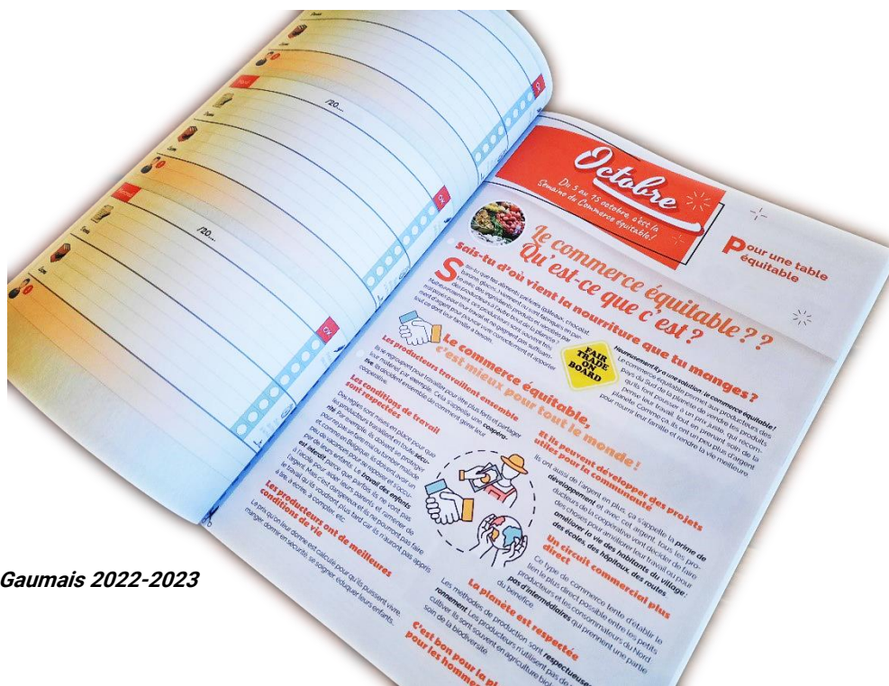
Journal de classe du p'tit Gaumais 2022-2023

Le mois d'octobre a été ponctué de découvertes et d'actions de sensibilisation au sein des écoles de la commune. Il a d'abord débuté dans le journal de classe des élèves, avec une fiche consacrée à la thématique.